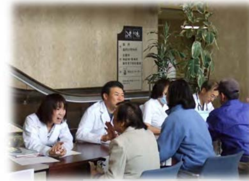
オープンホスピタル