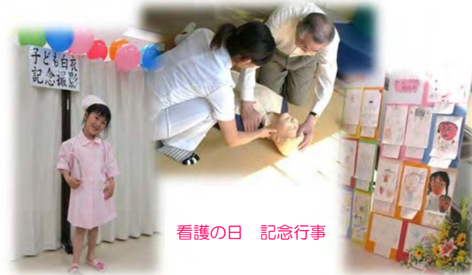
看護の日 記念行事