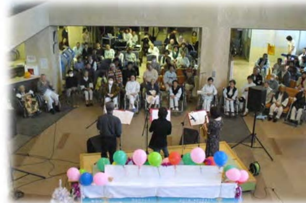
ハートフルコンサート

看護の日やハートフルコンサート、オープンホスピタルなど患者サービスも積極的に行っています。